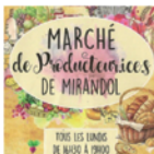
Communauté de Communes Mirandol