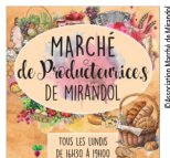
Association Marché de Mirandal

🕒 18h30-19h45 lundi. tous les lundis soirs 📍 Salle des Fêtes de Canitrot Tarif à l'unité / Forfait 5 cours.