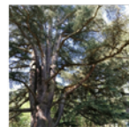
Domaine de la Verrerie

http://tourisme-tarn-carmaux.fr/boutique/