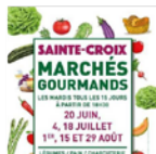
D.M.S. - M. S. Association