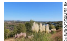
© IN SMAD CAP'DÉCOUVERTE - FBK