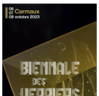
Direction: Karol, Carmaux, 2023 (14 octobre 2023)