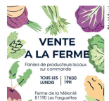
C. La Mouze

☎ 06 84 64 48 70 - 06 82 17 85 91 - 06 82 98 78 32 - 06 13 49 96 45